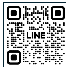
第26回のLINE公式アカウント