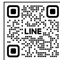
第25回フルートフェスティバル in 福岡 LINE公式アカウント QRコード