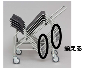
椅子片付け参考例 ※練習会場と同一のものではありません。