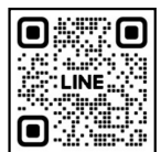
第25回フルートフェスティバル in 福岡 LINE公式アカウント QRコード

委員会側からのお知らせを一番早くキャッチできますので、是非ご登録お願い致します。