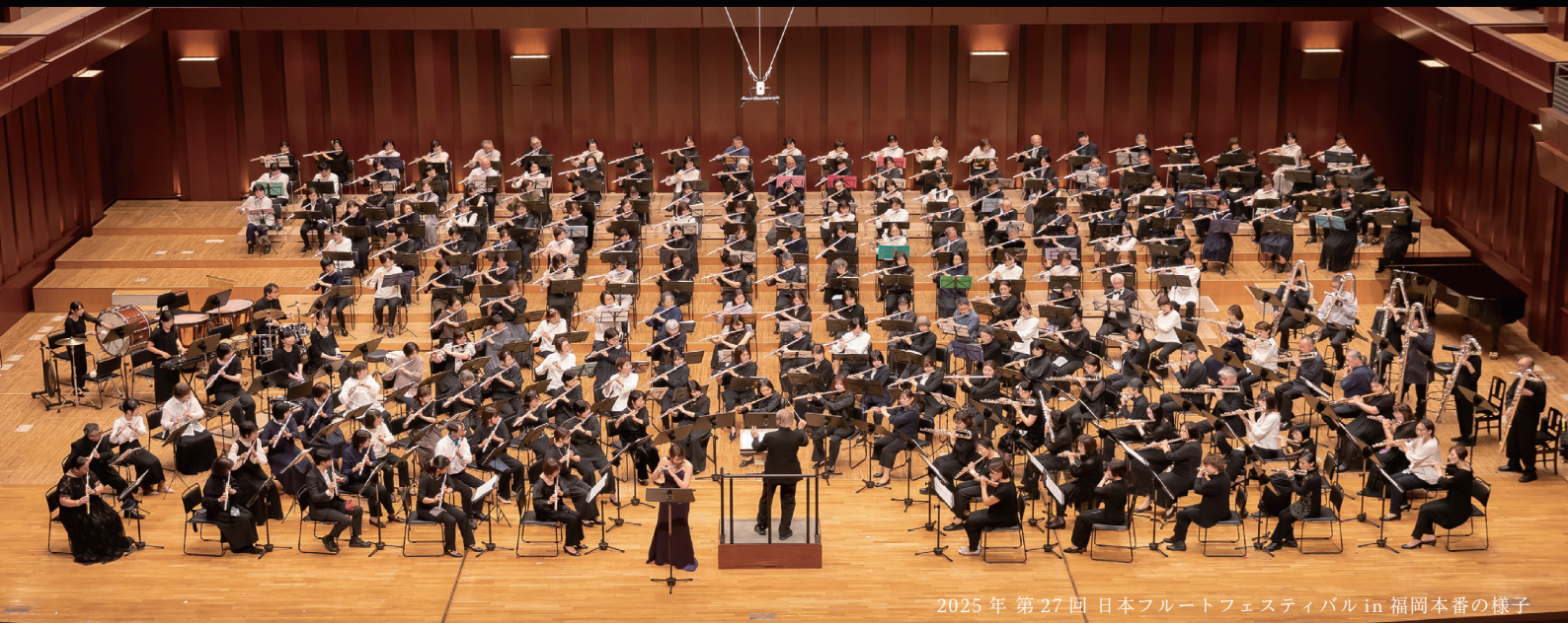
2025年 第27回 日本フルートフェスティバル in 福岡本番の様子